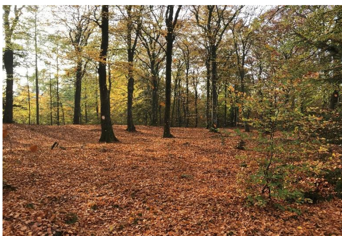
Vælderskoven i efterårspragt