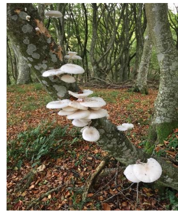
Efterårsskov og løvfald