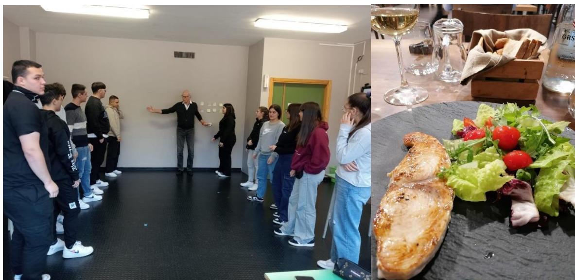
Redaktionens udsendte instruerer italienske gymnasieelever i par-orienteringsløb – og nyder en vel fortjent middag – UDEN gløgg