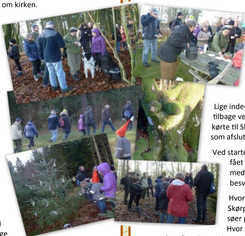
Undervejs kom vi forbi et gammelt bøgetræ, som er blevet opkaldt efter en amerikansk blondine. Gæt hvem.

Efterhånden som vi nærmede os byen, bredte der sig en dejlig duft, og hvis man fulgte den, stod man pludselig på en terrasse, hvor der blev serveret gløgg og æbleskiver.